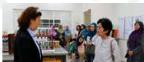
▲ Rombongan PPWS dibawa melawat ke bilik-bilik makmal di Institut ini