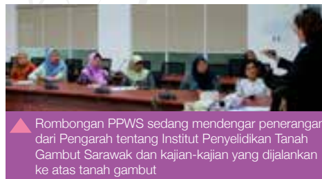
▲ Rombongan PPWS sedang mendengar penerangan dari Pengarah tentang Institut Penyelidikan Tanah Gambut Sarawak dan kajian-kajian yang dijalankan ke atas tanah gambut