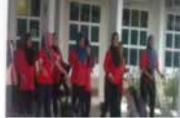
Ahli-ahli dari PPWS Cawangan Beladin sedang melakukan senaman senamrobik di Klinik Kesihatan Beladin ▲