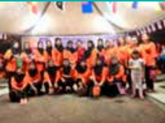
◀ Seramai 28 orang ahli-ahli PPWS Cawangan Emerald Kapit dan PPWS Cawangan Kampung Baru Kapit sama-sama meraikan Pesta Tanglung