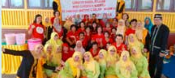
Gambar beramai-ramai 23 orang ahli PPWS Cawangan Kuching semasa lawatan