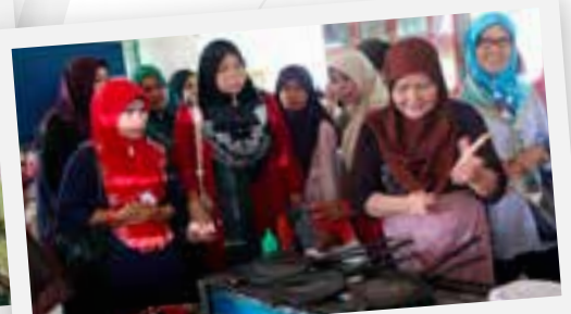
▲ Ahli-ahli PPWS memerhatikan pengusaha kuih sepiit Mukah membuat demo membuat kuih sepiit gulong