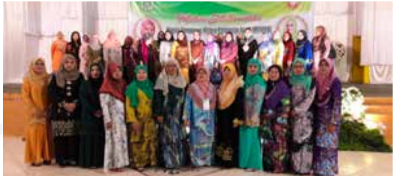
▲ Gambar kenangan sempena jamuan makan malam yang dihoskan oleh Majlis Perempuan Melayu Kalimantan Barat