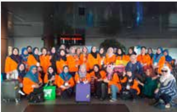
▲ Ahli-ahli PPWS yang mengikut rombongan lawatan ke Pontianak telah selamat tiba di Lapangan Terbang Pontianak