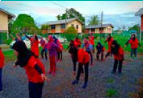
◀ PPWS dijemput menghadiri program Program Gabungan Pusat Aktiviti Warga Emas (PAWE) Pusa. Salah satu aktiviti yang diadakan ialah aktiviti senamrobik beramai-ramai di Bangunan PAWE di Pusa