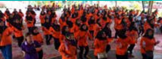
▲ Seramai 306 orang ahli-ahli PPWS meraikan Sambutan Hari Keluarga dan Hari Malaysia yang dianjurkan oleh PPWS Daerah Sarikei