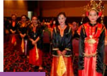
Wajah-wajah di Majlis Makan Malam