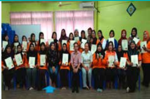
▲ Ahli-ahli PPWS Daerah Lawas yang menyertai Bengkel Membuat Sabun Kecantikan