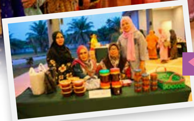
Salah satu booth jualan oleh ahli dari PPWS Daerah Kapit