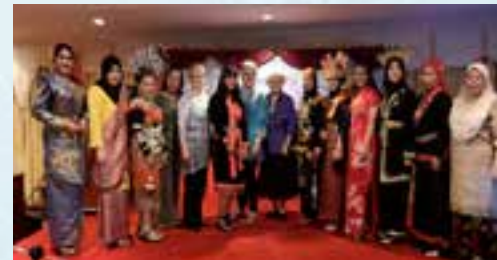
Majlis Makan Malam bersama ahli-ahli PPWS Daerah Miri/Lutong dan Bekenu di Mega Hotel sempena Lawatan World President dan Bendahari ACWW. Ahli-ahli menggayakan pakaian tradisional mewakili suku kaum ahli-ahli PPWS di Daerah Miri dan Daerah Bintulu