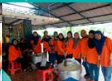
◀ PPWS Cawangan Jalan Haji Karim Sarikei mengadakan aktiviti gotong royong memasak bubur asyura yang disertai oleh seramai 15 orang ahli-ahli PPWS.