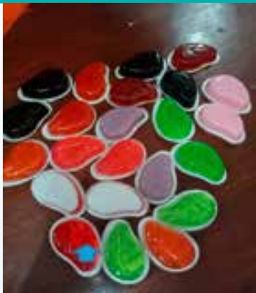
▲ Sabun yang dihasilkan