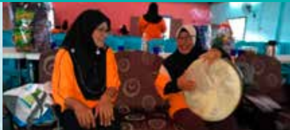
Ahli dari PPWS Cawangan Tebelu mencuba memukul gendang di PPWS Cawangan Kampung Sejaie yang sememangnya terkenal dengan budaya Mukun Sarawak

Kampung Sejaie, Sadong Jaya, 28 Oktober 2018