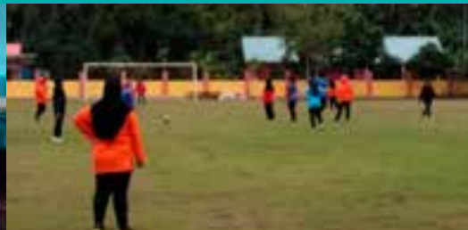
Perlawanan Persahabatan Bola Sepak di antara 2 buah Cawangan di Padang Bola Kampung Sejaie, Sadong Jaya