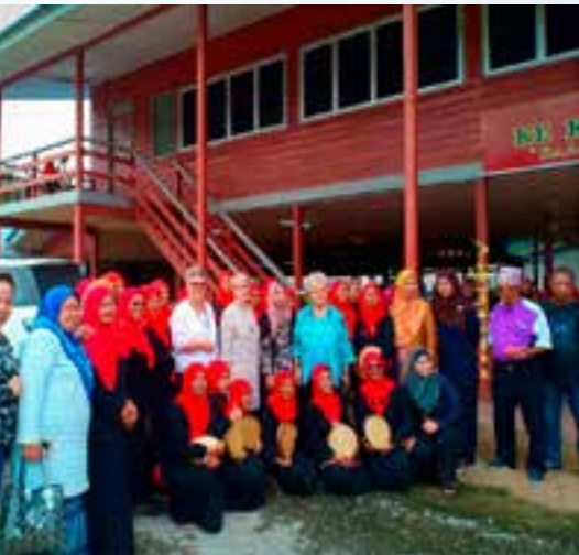
Gambar kenangan bersama Kumpulan Kompang PPWS Kampung Kelulut, Bekenu