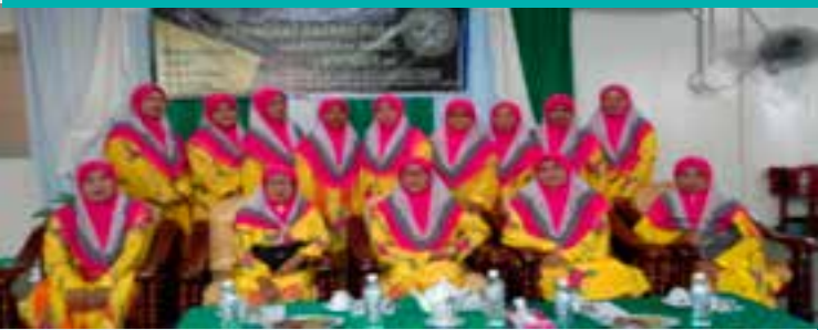
Penglibatan ahli-ahli dari PPWS Cawangan Kampung Tengah Meludam meraikan Sambutan Maal Hijrah ▲