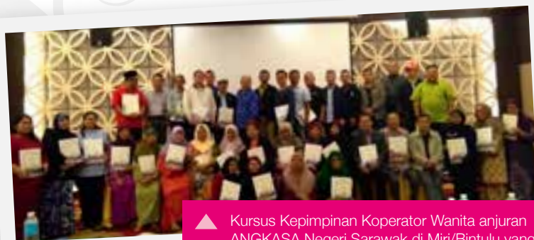
▲ Kursus Kepimpinan Koperator Wanita anjuran ANGKASA Negeri Sarawak di Miri/Bintulu yang dihadiri oleh beberapa orang ahli KOPERWANIS