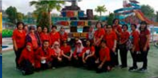
Gambar kenangan di Kurnia Waterpark, Melawi