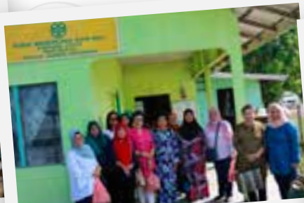
▲ Gambar kenangan di luar bangunan pusat memproses kuih asli