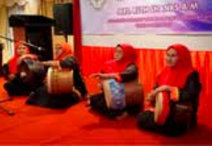
Persembahan Gendang dari ahli-ahli PPWS Cawangan Kampung Pintasan Tiris, Bekenu